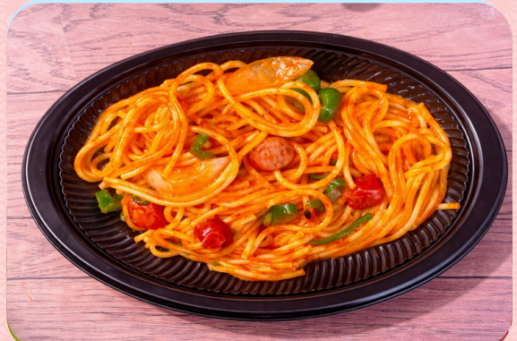
④ 昔ながらのナポリタン