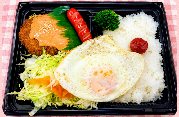
② オーロラメンチ弁当