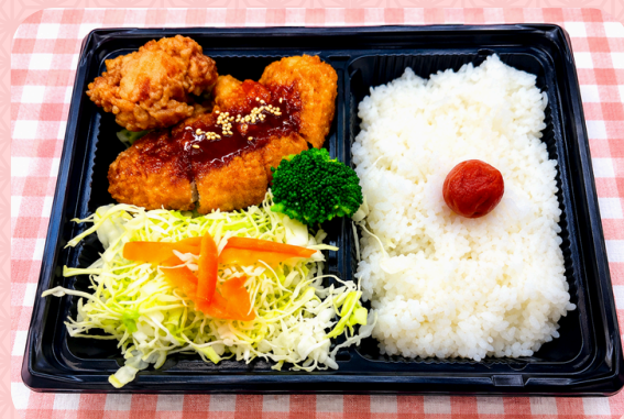
③ みそカツロース弁当